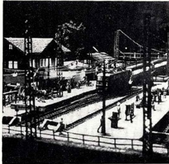
Unser Titelbild: Kopfbahnhof St. Niklaus bei Nacht (Einzelheiten dieser hervorragend gestalteten H0-Anlage von B. Schmid werden 1972 im Mm beschrieben)

Vierte Umschlagseite: Mit Vollidampf nehmen die beiden Dampflok der BR 050 die Steigung (Dg 7229 beim Haltepunkt Michelbach) Bilz, Aufnahme 8. 1. 1971, 16 Uhr