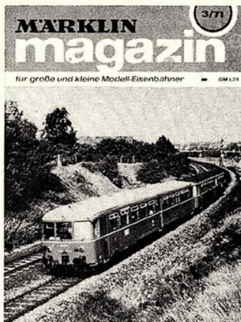
Unser Titelbild: Akkumulatortriebwagen der BR 515 mit Steuerwagen 815 vor Husum

Vierte Umschlagseite: Ein ungewöhnliches Gespann. Der TEE „Bavaria“ fährt als Wagenzug mit einer Diesellok der BR 210 (siehe auch „Mit- teilungen aus dem Großbetrieb“, S. 36)