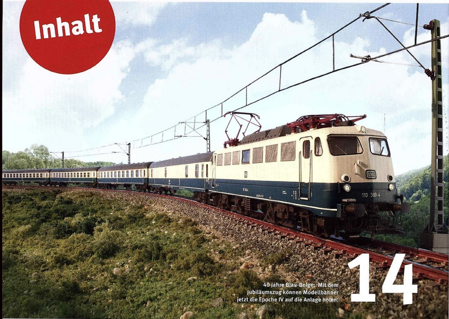
40 Jahre Blau-Beige: Mit dem Jubiläumszug können Modellbahner jetzt die Epoche IV auf die Anlage holen.