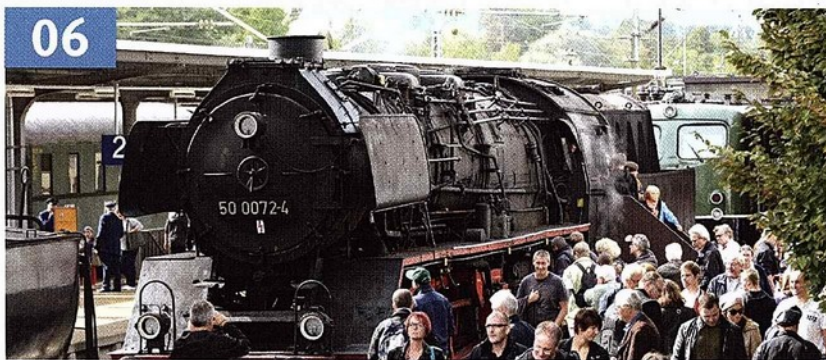
Unter Dampf: Großer Bahnhof für die Welt der Eisenbahnen.