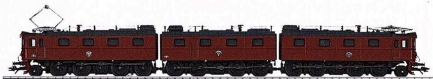
Jetzt im Märklin-Fachgeschäft: die schwere Erzlok Dm3 aus Schweden.