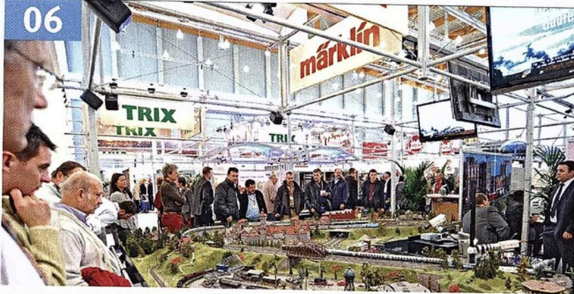
Modellfeuerwerk: Märklin präsentiert 2013 über 300 Neuheiten.