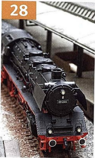
Komplett neu konstruiert: das H0-Modell der Schlepp- tender-Lok BR 03