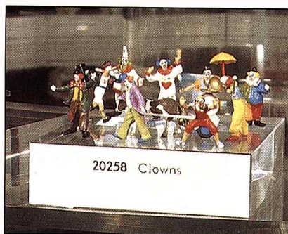
Clown-Stimmung von Preiser