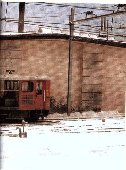
Ein famoses Diorama, ganz anders als bislang bekannt ausgestattet, finden Sie ab Seite 62.